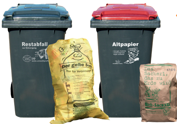
Auskunft über Abholtag & Turnus auf ihrer Gemeinde